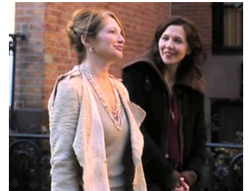
2005 CHASSÉ-CROISÉ À MANHATTAN (Trust the Man) de Bart Freundlich avec Maggie Gyllenhaal