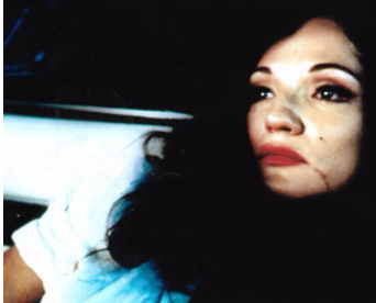
1998 LAS VEGAS PARANO (Fear and Loathing in Las Vegas) de Terry Gilliam