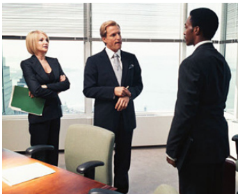
2004 SHE HATE ME (She hate me) de Spike Lee avec Woody Harrelson, Anthony Mackie