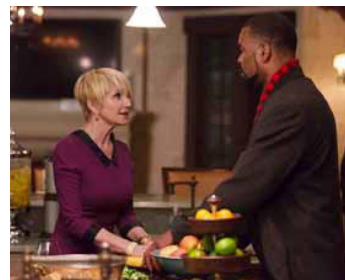
2014 THE COBBLER (The Cobbler) de Thomas McCarthy avec Method Man