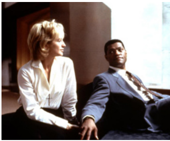
1995 DUO MORTEL (Bad Company) de Damian Harris avec Laurence Fishburne