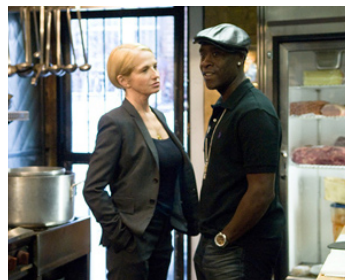
2009 L'ÉLITE DE BROOKLYN (Brooklyn's Finest) d'Antoine Fuqua avec Don Cheadle