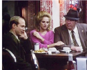
1986 ACT OF VENGEANCE (Act of Vengeance) de J. Mackenzie avec Hoyt Axton, R. Schenkkan