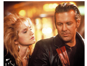
1989 JOHNNY BELLE GUEULE (Johnny Handsome) de Walter Hill avec Mickey Rourke