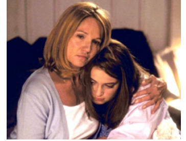
2000 CRIME + PUNISHMENT (Crime and Punishment in Suburbia) de Rob Schmidt avec Monica Keena