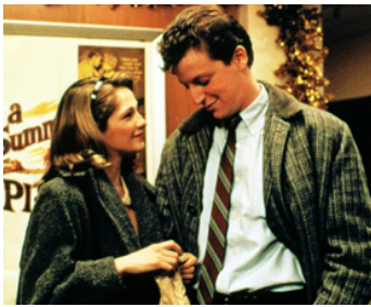
1982 DINER (Diner) de Barry Levinson avec Daniel Stern