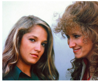
1983 TENDRE BONHEUR (Tender Mercies) de Bruce Beresford avec Betty Buckley