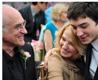
2011 ANOTHER HAPPY DAY de Sam Levinson avec Ezra Miller, Sam Levinson