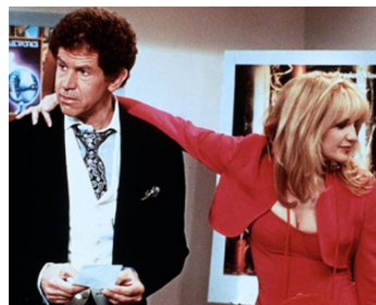
1991 DANS LA PEAU D'UNE BLONDE (Switch) de Blake Edwards avec Tony Roberts