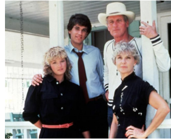
1984 L'AFFRONTEMENT (Harry & Son) de et avec Paul Newman, Robby Benson, Joanne Woodward