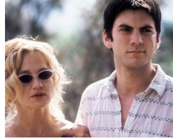
1999 THE WHITE RIVER KID d'Arne Glimcher avec Wes Bentley