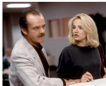
1992 MAN TROUBLE (Man Trouble) de Bob Rafelson avec Jack Nicholson