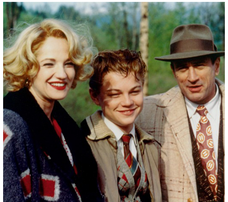
1993 BLESSURES MORTELLES (This Boy's Life) de Michael Caton-Jones avec Robert De Niro, Leonardo De Caprio