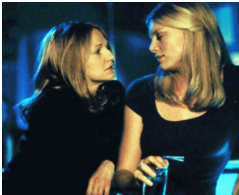
2000 AMOURS MORTELLES (Mercy) de Damian Harris avec Peta Wilson