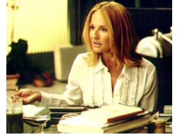
2001 ATTRACTION ANIMALE (Someone like you...) de Tony Gilroy