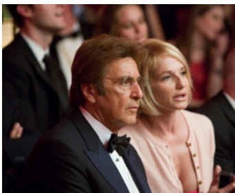
2007 OCEAN'S TWELVE (Ocean's Twelve) de Steven Soderbergh avec Al Pacino