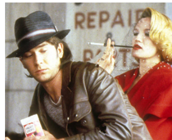
1987 BIENVENUE AU PARADIS (Made in Heaven) d'Alan Rudolph avec Timothy Hutton