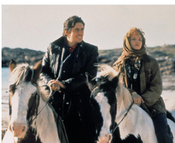
1992 LE CHEVAL VENU DE LA MER (Into the West) de Mike Newell avec Gabriel Byrne