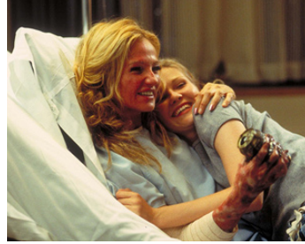
1999 BELLES À MOURIR (Drop Dead Gorgeous) de Michael Patrick Jann avec Kirsten Dunst