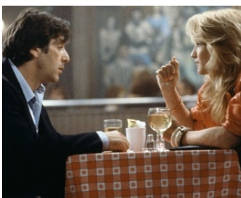
1989 MÉLODIE POUR UN MEURTRE (Sea of Love) d'Harold Becker avec Al Pacino