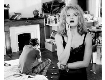
1986 DOWN BY LAW (Down by Law) de Jim Jarmush avec Tom Waits