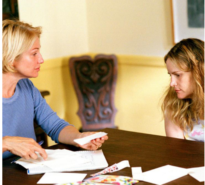
2004 PALINDROMES (Palindromes) de Todd Solondz avec Jennifer Jason Leigh