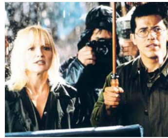
1996 LE FAN (The Fan) de Tony Scott avec John Leguizamo