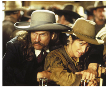
1995 WILD BILL (Wild Bill) de Walter Hill avec Jeff Bridges