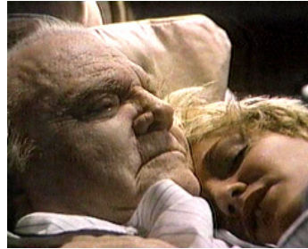
1984 JOE MORAN LE TERRIBLE (Terrible Joe Moran) de Joseph Sargent avec James Cagney