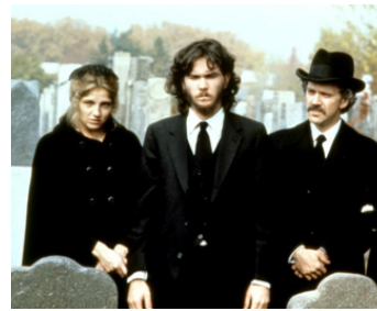
1983 DANIEL (Daniel) de Sidney Lumet avec Timothy Hutton, John Rubinstein