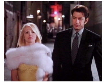
1996 MAD DOGS (Mad Dog Time) de Larry Bishop avec Jeff Goldblum